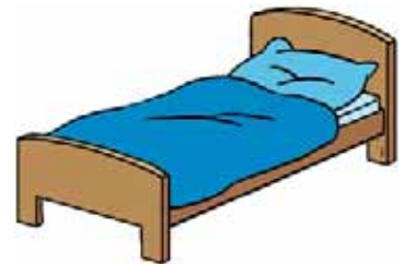
Voor het slapen