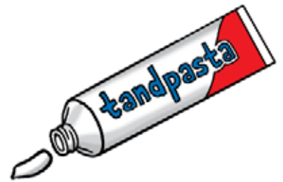
Een klein beetje tandpasta