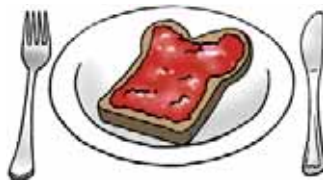
Na het ontbijt