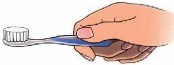
Een tandenborstel met zachte haren