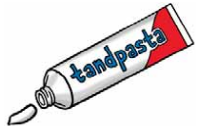
Een klein beetje tandpasta