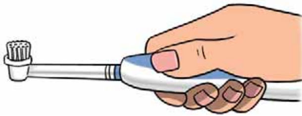
Een tandenborstel met zachte haren